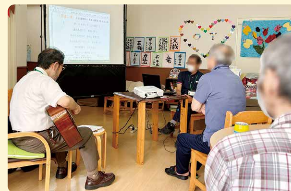
社会復帰病棟で行なわれた歌会

1対1の個人カウンセリングは主に外来で行いますが、病棟ではグループワークをしています。こころの痛み・疲れ・イライラ・ワサワサは、血液検査やレントゲンなどで数字や画像としてとらえにくいところがあります。これらを和らげていくために、思いや考えを言葉にすることが大事なのですが、なかなか難しい！その練習をグループで、なるべく楽しく、少しずつ試みています。また、一週おきに懐メロの歌会もやっています。気分転換をしながら、うら