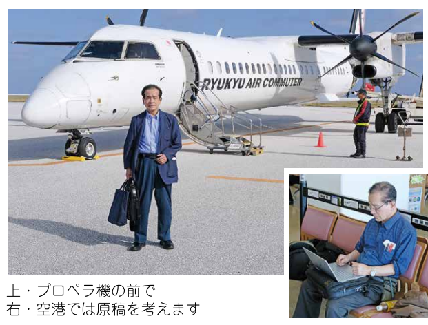
上・プロペラ機の前で 右・空港では原稿を考えます