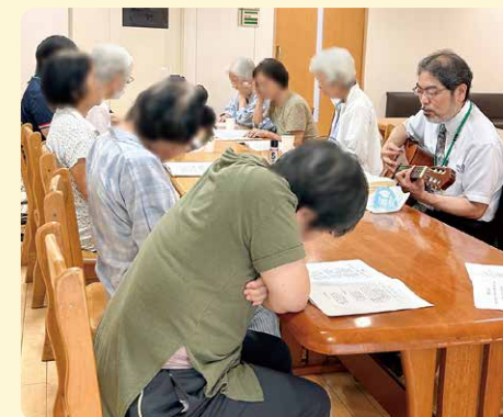
急性期病棟で行なわれた歌会