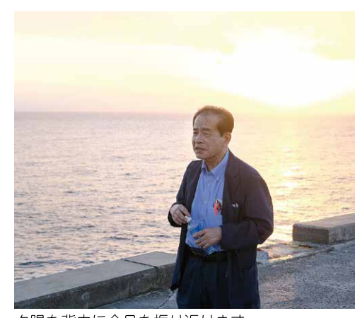
夕陽を背中に今日を振り返ります

す。村のホームページによると、北大東村は沖縄で2番目に、全国では15番目に人口が少ない自治体だそうです。人口は600人弱、世帯数は300世帯ですが、県平均に比べると年少人口率は高く、高齢化率は低くなっており、少子高齢化は進んでいないようです。(令和4年4月時点) 診療場所は村福祉センターの一